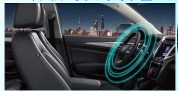
智能交通全自主安全驾驶