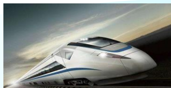
智能交通大数据分析与健康管理