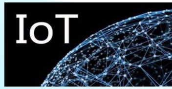
协作无线通信与智慧感知